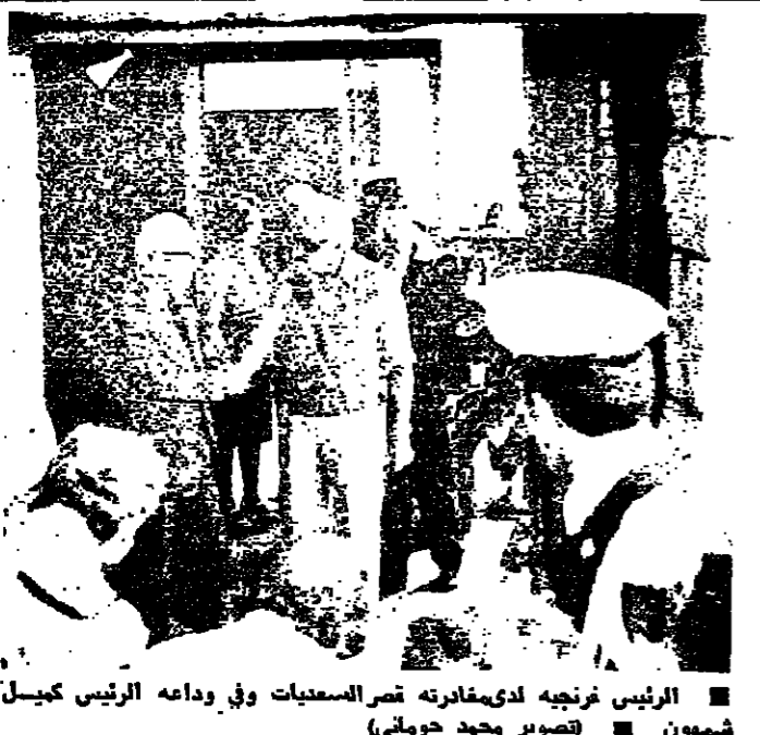
الرئيس فرنجيبة استقبل وزير الاعلام المصري الدكتور كمال ابو الجند ، ويبدو من البيان ، والنائب الدكتور مبدالله الراسي ، وزير الاعلام محمود عيسر ، السفير السعودي الشيخ محمد منصور الربيع، مدير عام وزارة الاعلام السيد رامز خزن